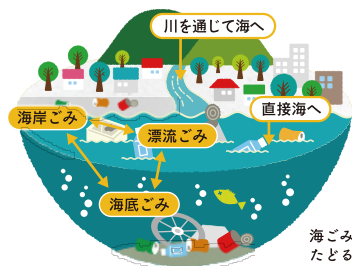
海ごみのたどるルート

瀬戸内海の家ごみは、ほとんどが瀬戸内海沿岸で発生したもので、山や里（まち）から川などを通じて海へ流れ出たものです。日々の生活の中でごみの発生を少なくすることが、海ごみの減少につながります。私たち一人ひとりでできることから始めてみましょう。